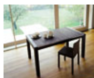
La storia di Astor