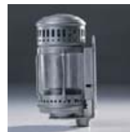
Faro da bicicletta