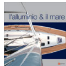
Alluminio e il mare

Alscon comincia la vendita locale di alluminio