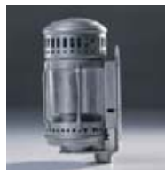
Faro da bicicletta

Cresce la quota di riciclo di lattine in Europa