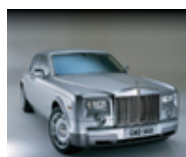
Rolls Royce Phantom