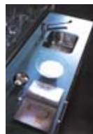
"Piano di lavoro"